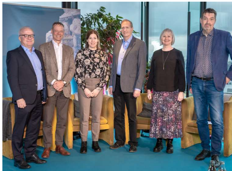
HAKI Safety Summit 2022

Safety Summit landade även i en insikt om att forum behövs för att aktörer ska kunna samlas över gränserna och diskutera möjliga lösningar och vägar för att uppnå en trygg och säker arbetsmiljö för landets många företag inom byggbranschen.